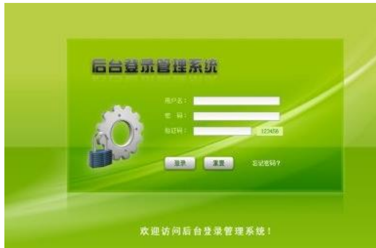
图 3-1 系统登陆界面图