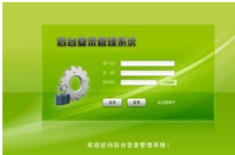
图 3-1 系统登陆界面图